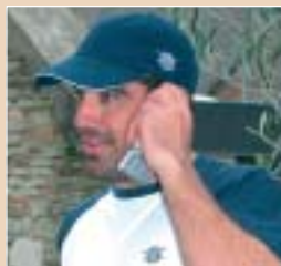
Casquettes, polos piqués, tee-shirts brodés, pulls, gilets, sweat