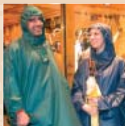
Les capuchons en tissu de parapluie brodé