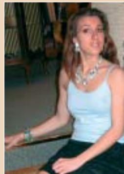
Tops, bijoux, montres