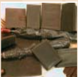
Petite maroquinerie, porte-monnaie, portefeuille, porte-photos, gants conduite