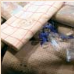
Torchons, lins et métais brodés