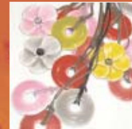
Bijoux Franck Herval, Eden, Cormenier