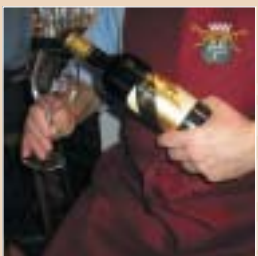
Tablier de sommelier, verres cristal gravé blason, décanteurs, carafes