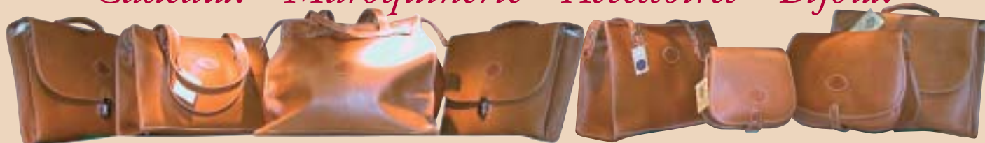
Cartables, besaces, shopping... tous nos cuirs en vachette pleine fleur, surpiqure écri made in France !