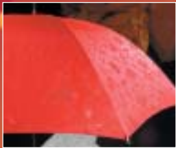
Le galbe de l'élégance