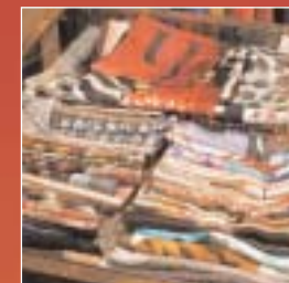
Carrés, Étoles, Soies