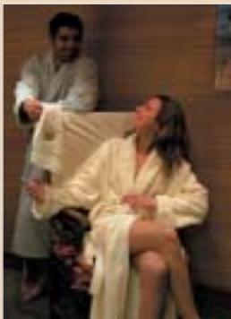
Peignoirs éponge homme et femme