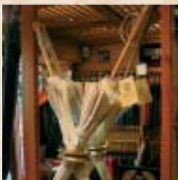
Ombrelles en coton ou soie et sur mesure