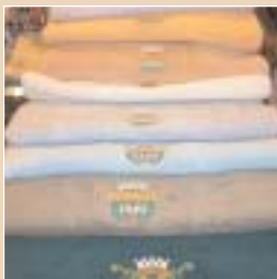
Éponges bord de mer toutes tailles