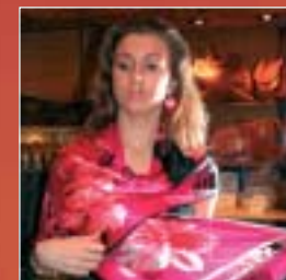
Étoles Léonard, Torrente, E. Khan