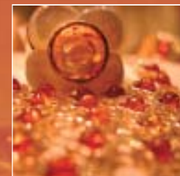
Bagues, bracelets, ambres de la Baltique