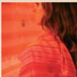
Étoiles tissées jacquard, lins, soies, cotons